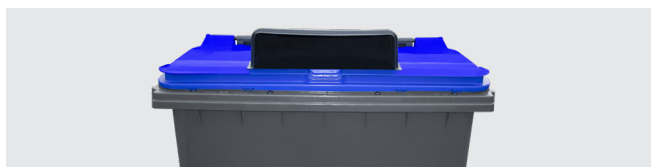
BOCAS DE SELEÇÃO PAPEL

Podem ser equipados com uma seleção de acessórios que oferecem soluções concretas para cada necessidade: pedal de abertura da tampa, bandas refletoras, fechadura, sistema ventral.