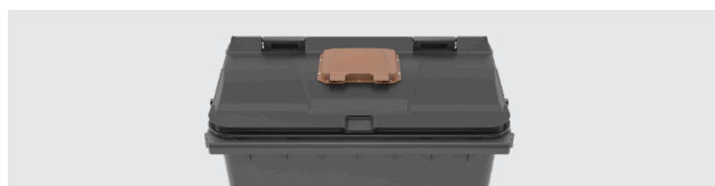
SOBRETAMPA Dimensão útil: 300 x 250 mm