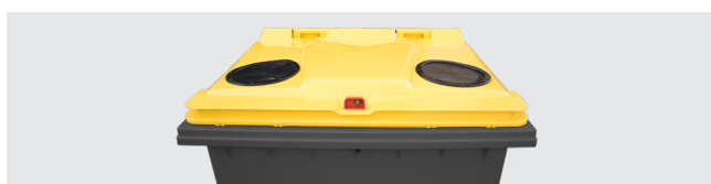
BOCAS DE SELEÇÃO EMBALAGENS