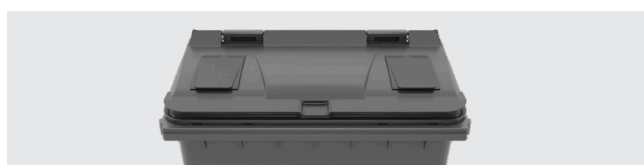
SOBRETAMPA DE BORRACHA Dimensão útil: 285 X 150 MM