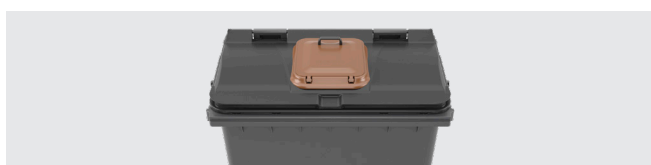
SOBRETAMPA GRANDES DIMENSÕES Dimensão útil: 400 x 330 mm